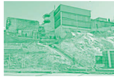
Der Aushub ist fertig.