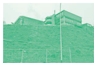
Der Wald ist gerodet.