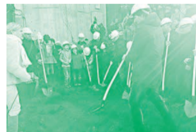
Kinder beim Spatenstich.