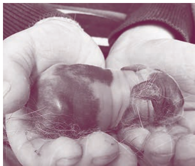
2 Tage alt.