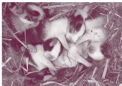
11 Tage alt.