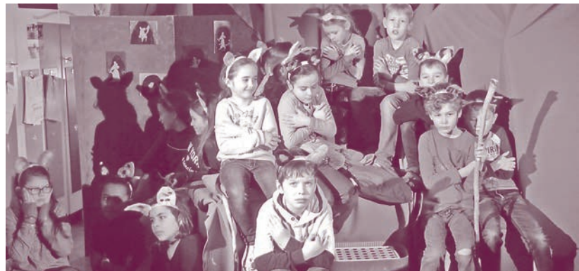
Wenn der kalte Herbstwind weht – Bild aus einer Probe.

Ein Musical, gespielt und gesungen von der 2. Klasse a