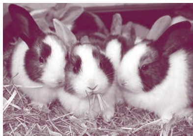
4 Wochen alt.